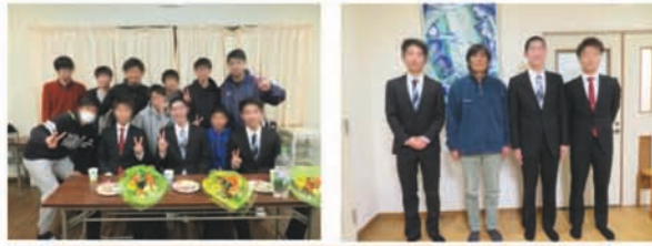
最後の雄姿！みんなカッコイイです！

今年3名の高校生が卒園を迎えました。調理実習は、3人とも10回近く行い、唐揚げやエビチリ、チャーハン、オムライスなどいろいろな料理を作り、みんなかなりスキルアップすることができました。また、自動車学校もあつと忙しい日々を過ごしました。送る会では、キャンプや球技大会の話に花が咲き、最後のあいさつでは、学園に残る子どもたちに素晴らしいメッセージを発信してくれました。みんな涙をこらえながら、別れを惜しんでいました。 新しい環境での生活が始まりますが、鹿児島島での就職・進学でもあり、すぐに会えると元氣よく出発して行きました。