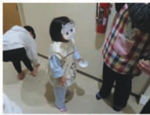
かわいい！ 笑顔最高！

毎年、5年生と職員で鬼役をしてそれぞれの部屋を回っていましたが、まん延防止の関係で部屋ごとに実施しました。