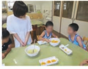
フルーツゼリーです。 甘いシロップでベタベ