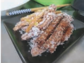
なんと、中高生の 男子は、チュロス な... かかた