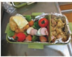
どのお弁当が一番？ 食べ比べをしたかった です。次は絶対や ります。