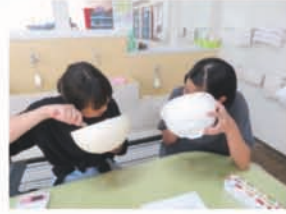
チーズケーキ！ すごくおいしかった