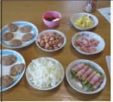
美味しくて 楽しい時間 でした。