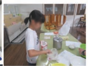
小学生女子で クッキーをつくりま