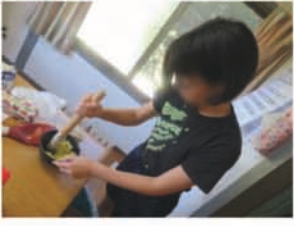
以外とみんな手際が良くて 驚きました。またやりたい という希望もあってぜひ 実現したいです。