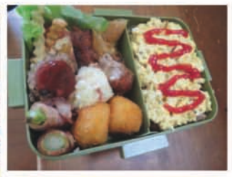
おいしそうですね。 努力の跡が見えます。 みんな頑張りました。